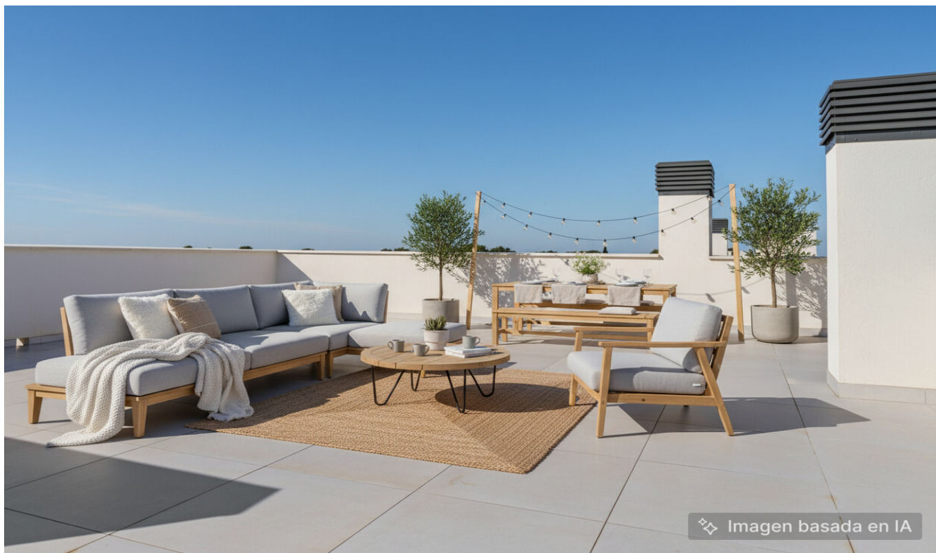
Imagem baseada em IA

PREÇO DE COMPRA: 768.000 EUR • ÁREA: ca. 94,06 m 2 • QUARTOS: 3