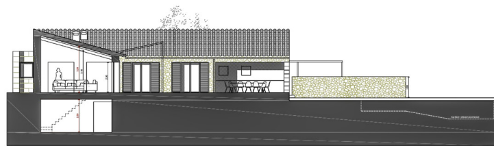
SECCION 0 E 1:50