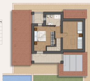
PIANTA PIANO PRIMO Scala 1:100

Esta planta não é à escala. Os documentos foram-nos entregues pelo cliente. Por conseguinte, não podemos assumir qualquer responsabilidade pela exatidão das indicações.