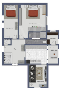
Imagem não realista