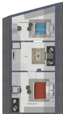
Diagrama de planta baixa de um imóvel residencial.

Esta planta não é à escala. Os documentos foram-nos entregues pelo cliente. Por conseguinte, não podemos assumir qualquer responsabilidade pela exatidão das indicações.