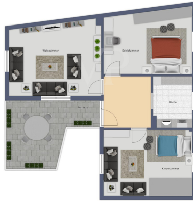
Diagrama de planta baixa de um imóvel residencial.