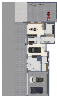
Imagem não escalada

Esta planta não é à escala. Os documentos foram-nos entregues pelo cliente. Por conseguinte, não podemos assumir qualquer responsabilidade pela exatidão das indicações.