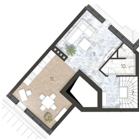
4. emelet 4. számú lakás