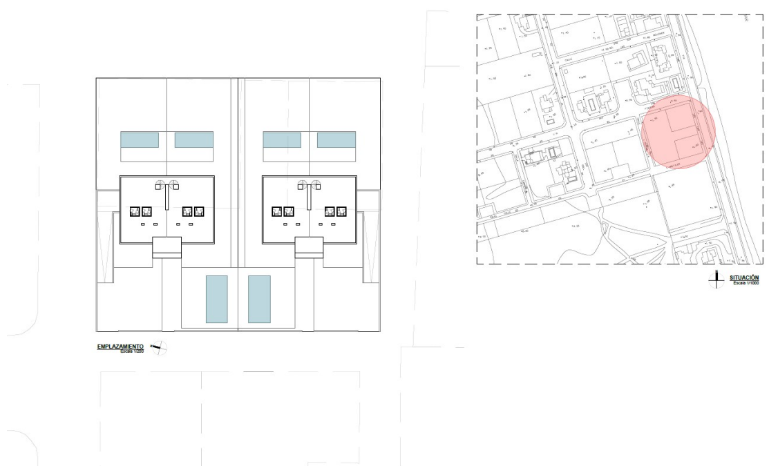
EMPLAZAMIENTO ESCALA 1:200