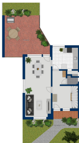
Diagrama não está em escala

Esta planta não é à escala. Os documentos foram-nos entregues pelo cliente. Por conseguinte, não podemos assumir qualquer responsabilidade pela exatidão das indicações.