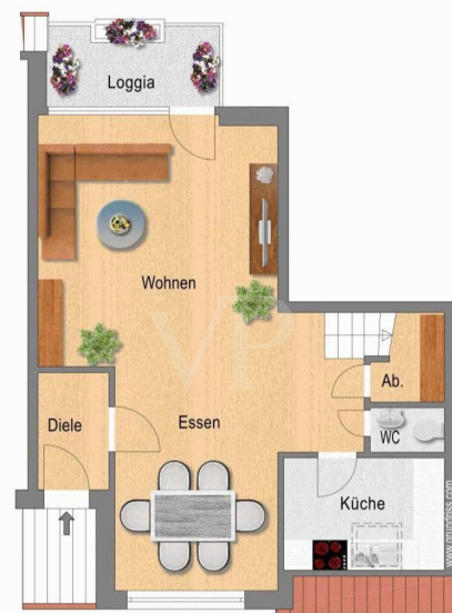
Grundriss Ebene DG