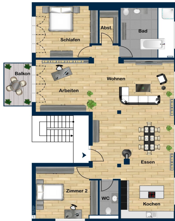
2. Obergeschoss Loft

Esta planta não é à escala. Os documentos foram-nos entregues pelo cliente. Por conseguinte, não podemos assumir qualquer responsabilidade pela exatidão das indicações.