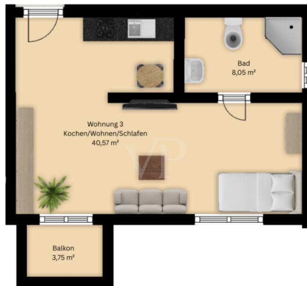
Wohnung 3 (50,49 m²)

Esta planta não é à escala. Os documentos foram-nos entregues pelo cliente. Por conseguinte, não podemos assumir qualquer responsabilidade pela exatidão das indicações.