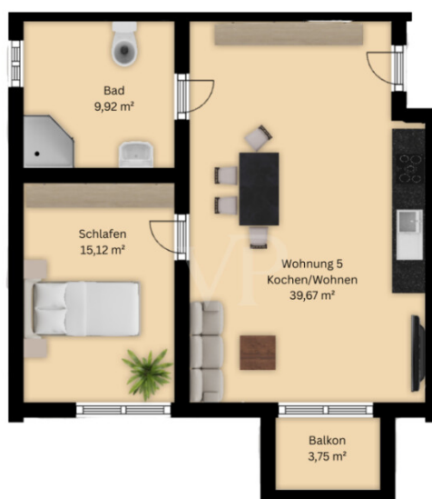
Wohnung 5 (66,58 m 2 )

Esta planta não é à escala. Os documentos foram-nos entregues pelo cliente. Por conseguinte, não podemos assumir qualquer responsabilidade pela exatidão das indicações.