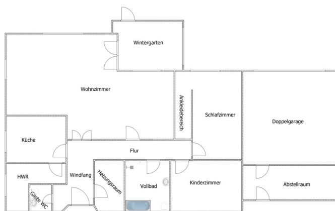
Erdgeschoss Achtung ! Unmaßstäbliche Angaben.

Esta planta não é à escala. Os documentos foram-nos entregues pelo cliente. Por conseguinte, não podemos assumir qualquer responsabilidade pela exatidão das indicações.