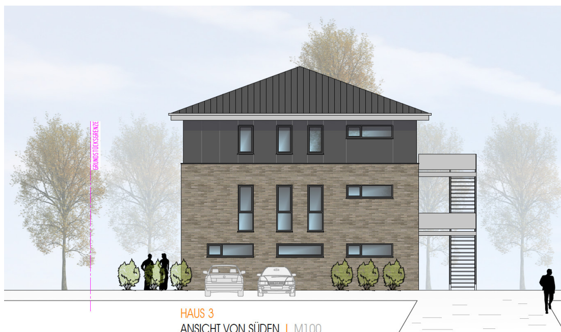
HAUS 3 ANSICHT VON SÜDEN | M100