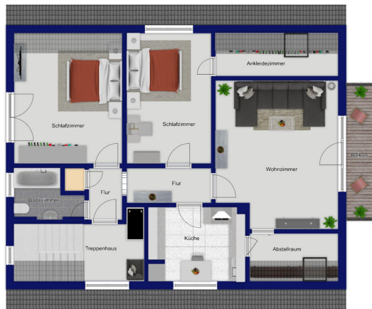
Immagine: 001 - real estate