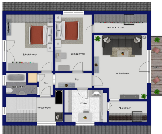
Immagine: 001 - 001/001/001