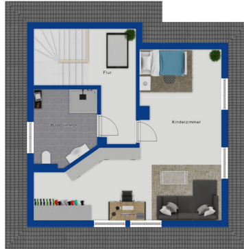
Immagine solo illustrativa