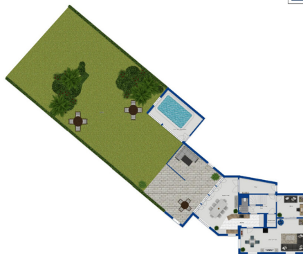
Immagine solo illustrativa

Questa pianta non è in scala. I documenti ci sono stati dati dal cliente. Per questo motivo, non possiamo garantire la precisione delle informazioni.