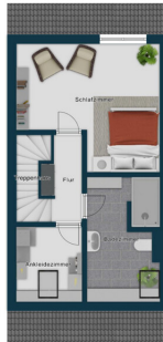
Immagine non visibile