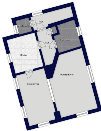
Immagine non scalabile

Questa pianta non è in scala. I documenti ci sono stati dati dal cliente. Per questo motivo, non possiamo garantire la precisione delle informazioni.