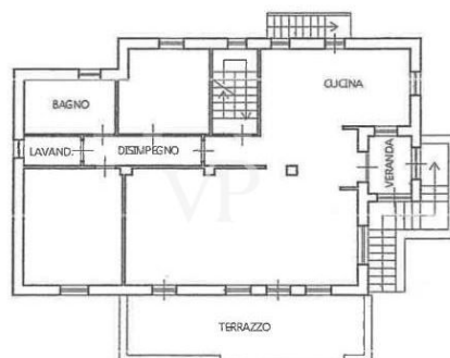
PIANO PRIMO H. = mt. 2,90