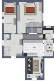
Immagine non scalabile