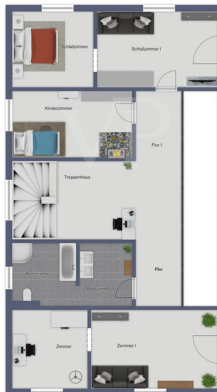
Image not available