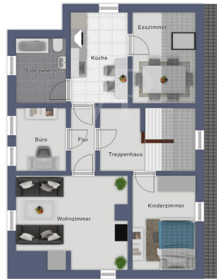
Immagine non visibile

Questa pianta non è in scala. I documenti ci sono stati dati dal cliente. Per questo motivo, non possiamo garantire la precisione delle informazioni.