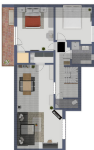
Immagine non visibile