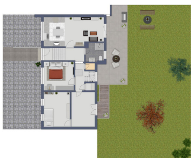
Immagine non visibile