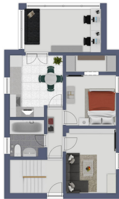
Immagine non caricata