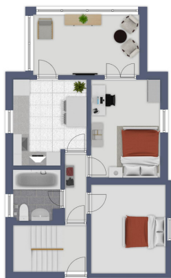
Immagine non caricata