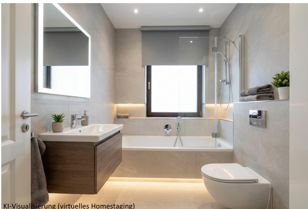
KI-Visualisierung (virtuelles Homestaging)