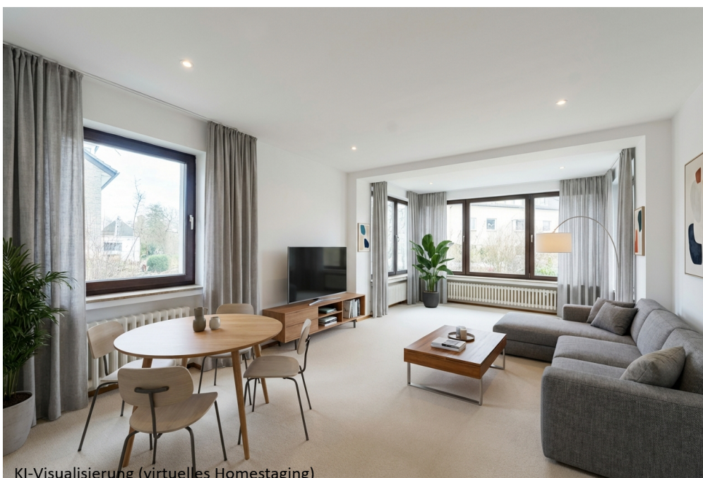
KI-Visualisierung (virtuelles Homestaging)