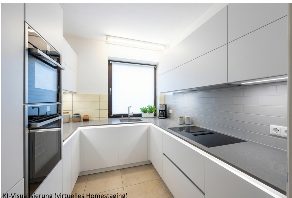
KI-Visualisierung (virtuelles Homestaging)