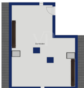
Immagine solo illustrativa

Questa pianta non è in scala. I documenti ci sono stati dati dal cliente. Per questo motivo, non possiamo garantire la precisione delle informazioni.