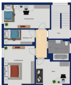
Immagine solo illustrativa