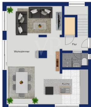
Immagine solo illustrativa