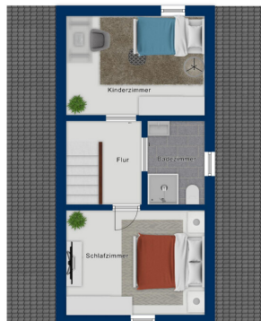
Immagine solo illustrativa

Questa pianta non è in scala. I documenti ci sono stati dati dal cliente. Per questo motivo, non possiamo garantire la precisione delle informazioni.