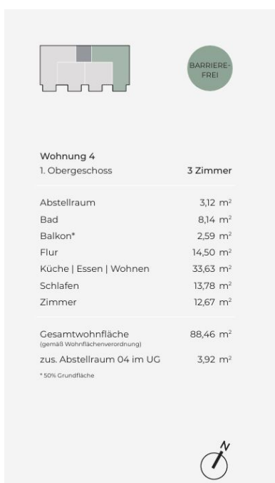
Herrschaftsgartenstraße 12 – Leben in Böblingen