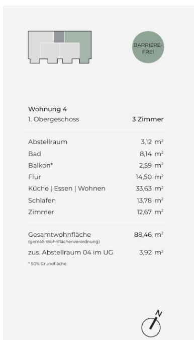
Herrschaftsgartenstraße 12 – Leben in Böblingen