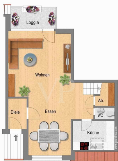
Grundriss Ebene DG