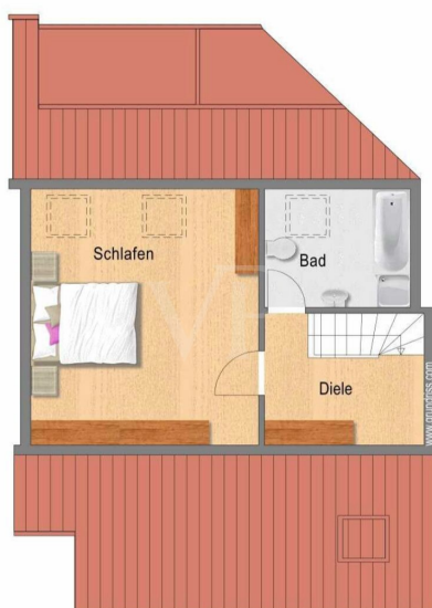
Grundriss Ebene Galerie