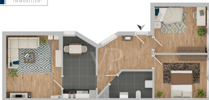
WE4 2. OG