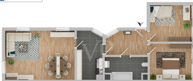
WE3 1. OG