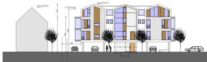
Ansicht Nord-Ost Variante 20°/20°