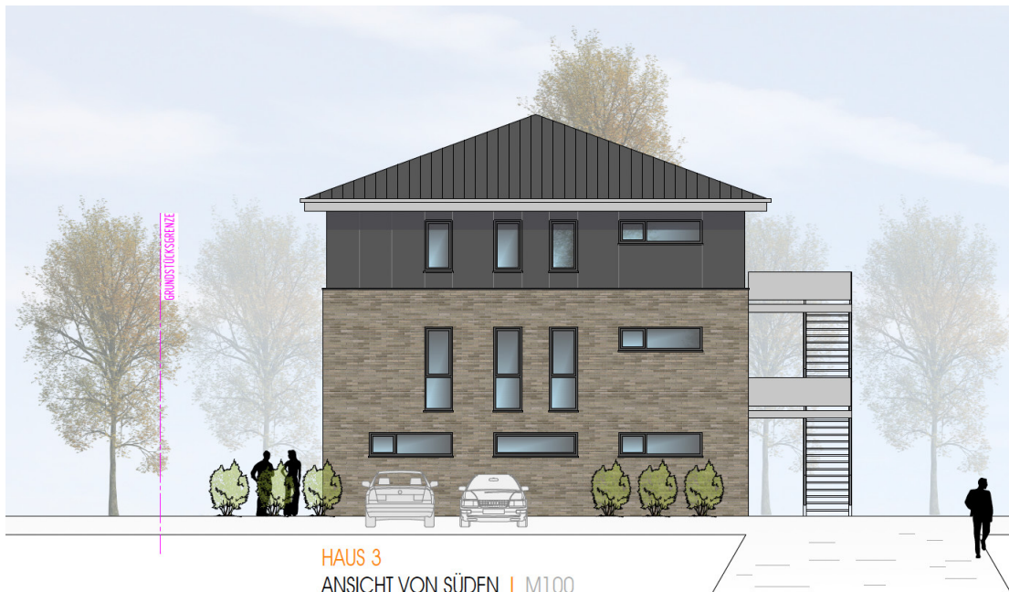
HAUS 3 ANSICHT VON SÜDEN | M100