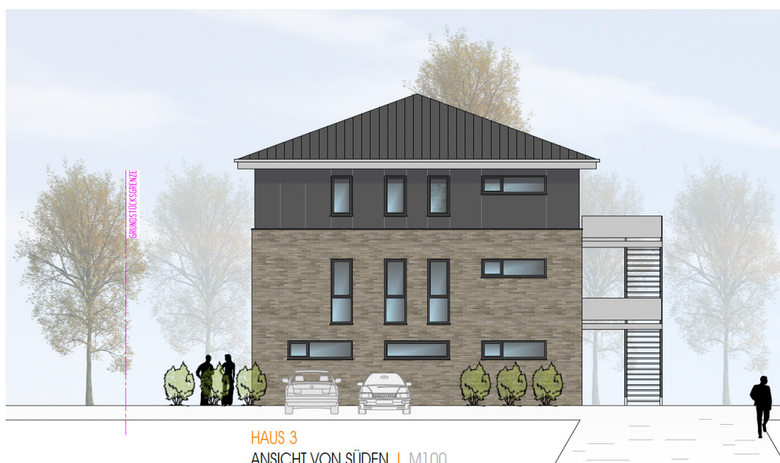
HAUS 3 ANSICHT VON SÜDEN | M100