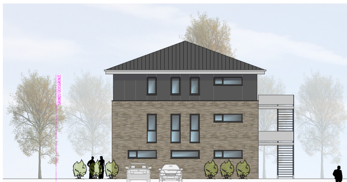
HAUS 3 ANSICHT VON SÜDEN | M100