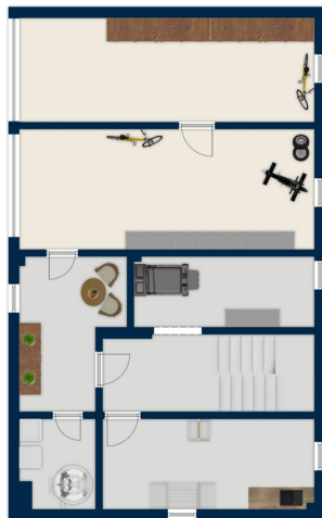
Diagramm: 1. Etage

Ez az alaprajz nem méretarányos. A dokumentumokat a megbízó adta át a részünkre. Az adatok helyességéért nem vállalunk felelősséget.