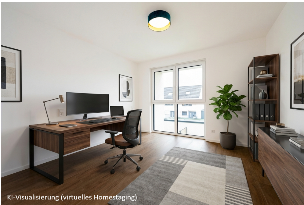
KI-Visualisierung (virtuelles Homestaging)