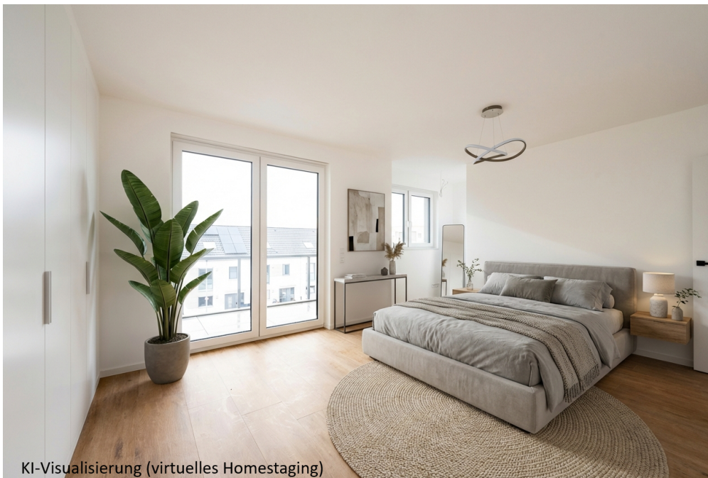
KI-Visualisierung (virtuelles Homestaging)