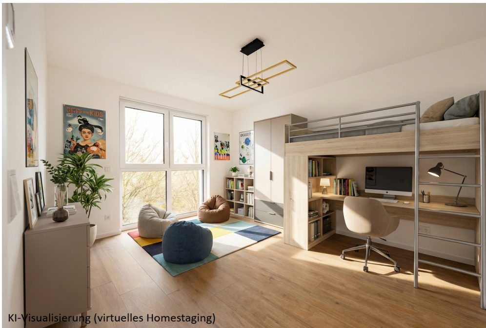
KI-Visualisierung (virtuelles Homestaging)