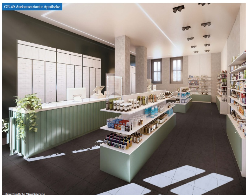
GE 49 Ausbauvariante Apotheke

Die Einheiten 56+57 können zusammengelegt werden.