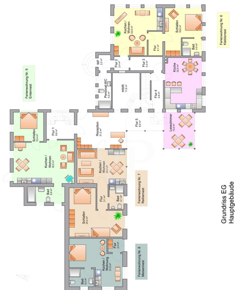
Grundriss EG Hauptgebäude