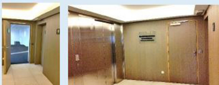
Level +4 Entrance