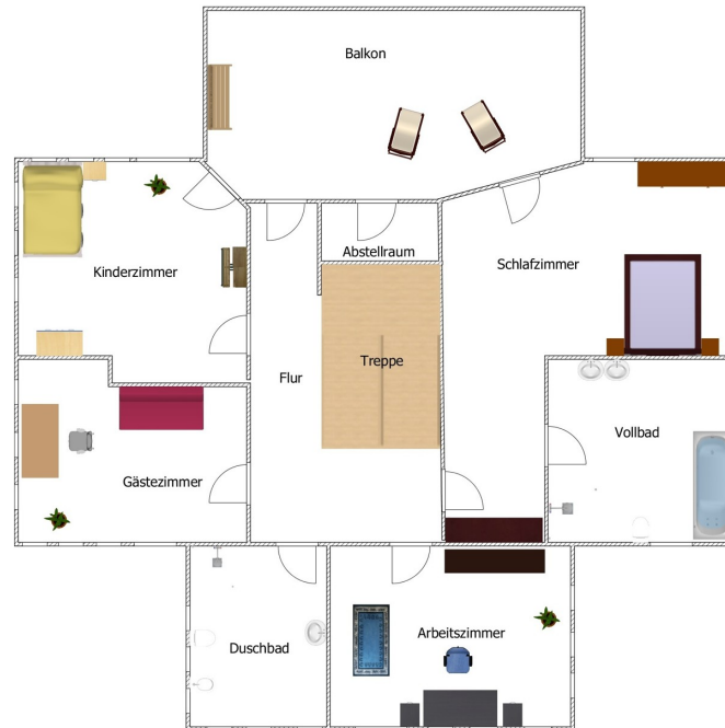
Dachgeschoss Achtung ! Unmaßstäbliche Angaben.