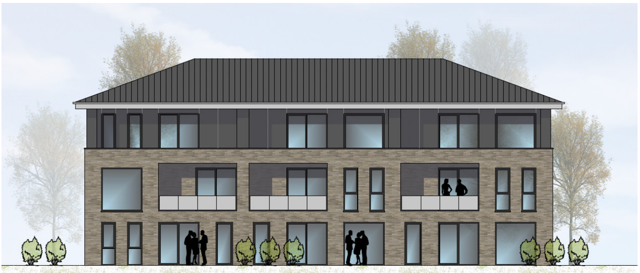
HAUS 3 ANSICHT VON WESTEN | M100