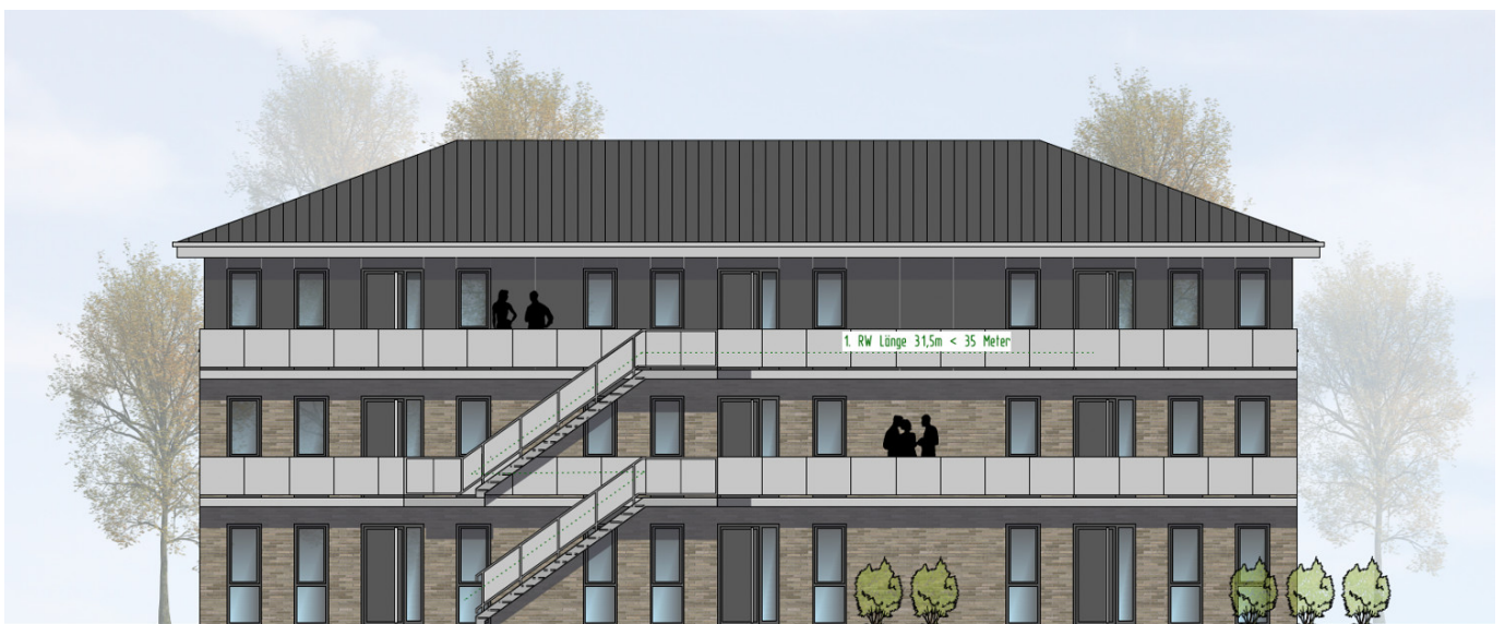
HAUS 3 ANSICHT VON OSTEN | M100