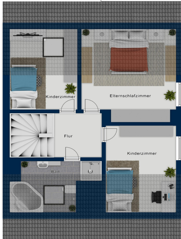
Fig. 01/2018 - 1/11/2018