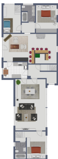
Exposplan, nicht maßstäblich