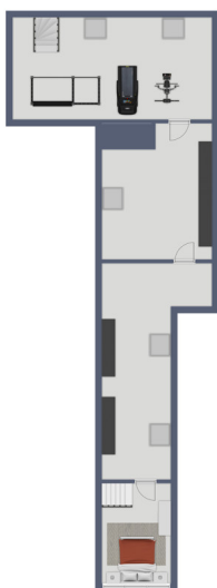
Exposplan, nicht maßstäblich