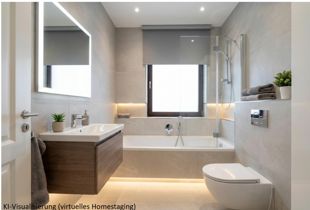
KI-Visualisierung (virtuelles Homestaging)