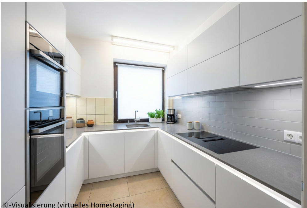
KI-Visualisierung (virtuelles Homestaging)