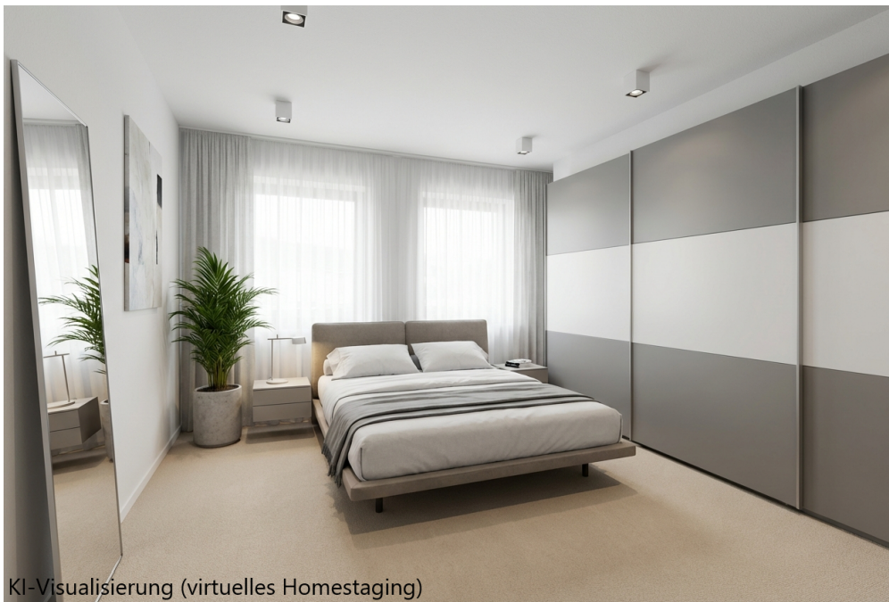
KI-Visualisierung (virtuelles Homestaging)