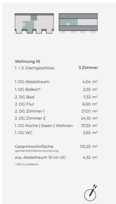
Herrschaftsgartenstraße 12 – Leben in Böblingen