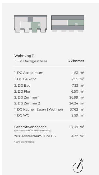
Herrschaftsgartenstraße 12 – Leben in Böblingen