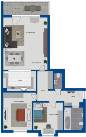
Kopierplan, nicht maßstabesgetreu

???? ? ?????? ??? ????? ?? ??????. ?? ?????? ??? ?????? ??? ??? ??????. ??? ?? ???? ?????, ??? ?????? ?? ?????????? ??? ?????? ??? ??????????.