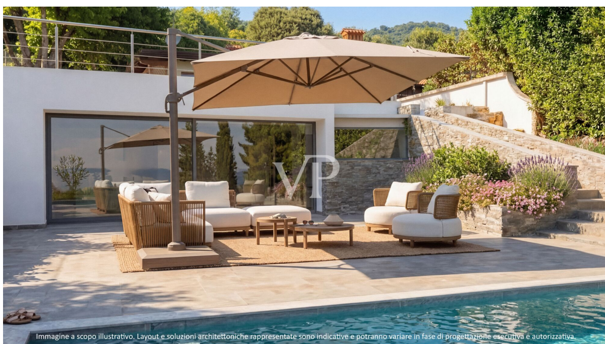
Immagine a scopo illustrativo. Layout e soluzioni architettoniche rappresentate sono indicative e potranno variare in fase di progettazione esecutiva e autorizzativa.