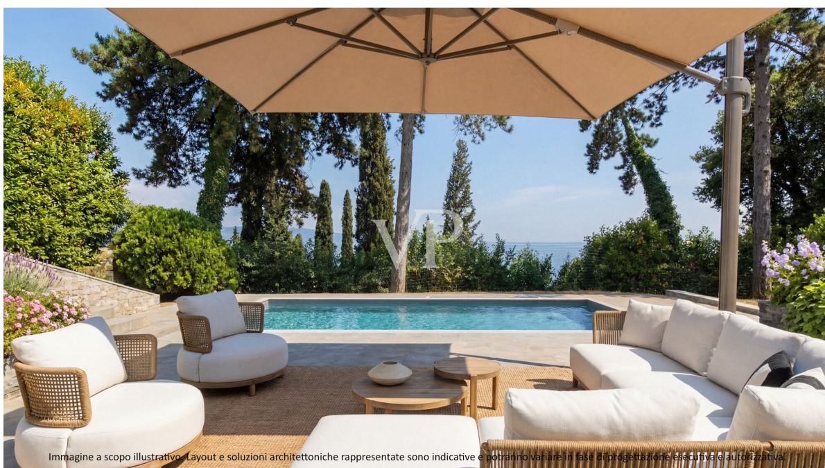
Immagine a scopo illustrativo. Layout e soluzioni architettoniche rappresentate sono indicative e potranno variare in fase di progettazione esecutiva e autorizzativa.