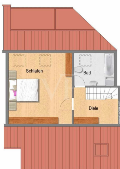
Grundriss Ebene Galerie