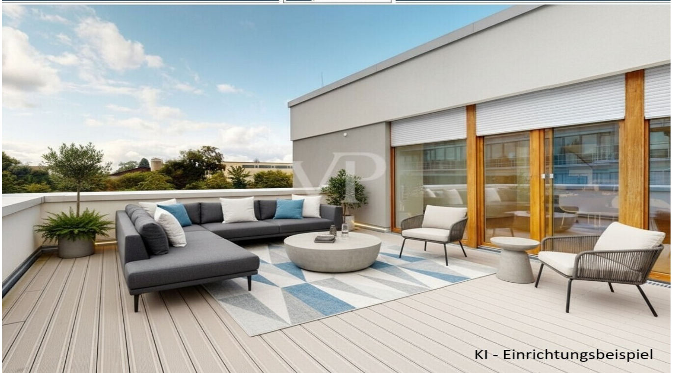
KI - Einrichtungsbeispiel

PRIX DE LOYER: 2.300 EUR • SURFACE HABITABLE: ca. 144,6 m 2 • PIÈCES: 3